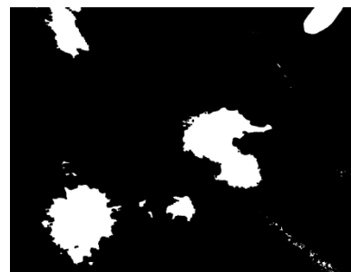
太陽と雲の領域に分割した画像