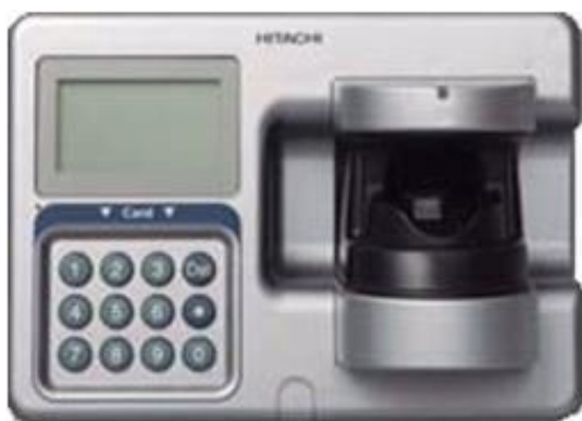
IC カードリーダー搭載の指静脈端末(AFV-730-TC)