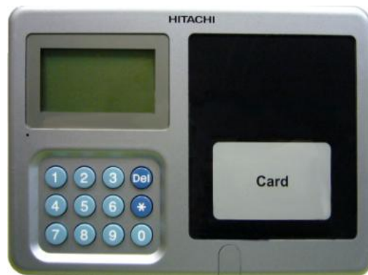
カードリーダー端末(ACR-730-T)

株式会社日立情報制御ソリューションズ(取締役社長:茅根 修、東京本社:東京都台東区秋葉原 6 番 1 号/以下、日立情報制御)は、このたび、2009 年から販売している AFV-700 シリーズ「指静脈入退管理システム」(*1)の機能を拡張し、住民基本台帳カードや IC 運転免許証などに使用されている国際標準 ISO/IEC14443(*2) Type-B(*3)に準拠した新製品を本日から販売開始します。